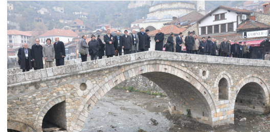
Şairler Prizren Köprüsü'nde